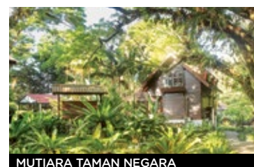
MUTIARA TAMAN NEGARA