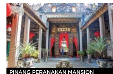
PINANG PERANAKAN MANSION

los días de 6.30 a 23. u$ 3,5 , entre 13 y 59 años; menores de 13 y mayores de u$ 1,7 .