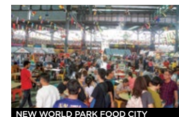
NEW WORLD PARK FOOD CITY

La estación del funicular está donde termina la Hill Railway Road. Es para pasar el día, cuenta con restaurantes, tiendas, un museo, cafetería, senderos y miradores. Dentro del parque está The Habitat , un circuito de pasarelas sobre la selva. El parque está abierto todos